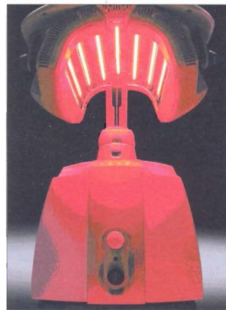
Figure 1 : Nouvel appareil LED haute puissance : LumiPhase-RTM (Opusmed, Canada) New high power, high end LED device: LumiPhase-RTM (Opusmed, Canada)

Karu a énoncé que l'impact de la biostimulation par laser dépendait de la condition physiologique de la cellule ciblée au moment de l'irradiation